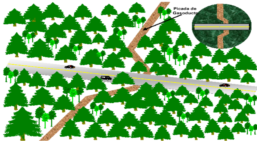
FIGURA 1 – CRUCE DE CAMINO / ZONA ARBOLADA